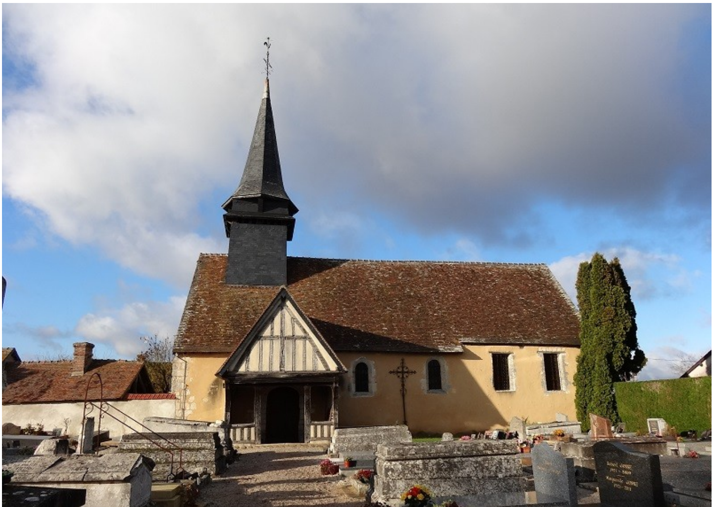
Photographie du monument historique